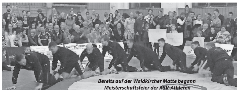
Bereits auf der Waldkircher Matte begann Meisterschaftsfeier der ASV-Athleten

Die ASV-Mannschaft sicherte sich somit nach einer durch die gesamte Saison mann- schaftlich geschlossene und beständige Leistung den Meisterschaftstitel in der Be- zirksliga, was für den ASV Vörstetten einen der größten Erfolge der jüngeren Vereinsge- schichte darstellt.