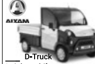
D-Truck Leichtmobile Tullastraße 6 79341 Kenzingen