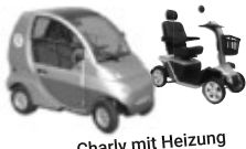
Charly mit Heizung

07644-92179-21 Fax: -20 · www.leichtmobile.de