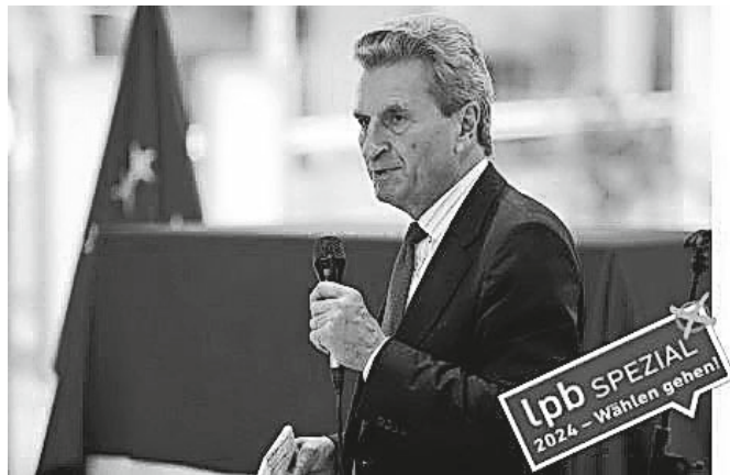
Günther Oettinger, European Union | P-040726/00-06