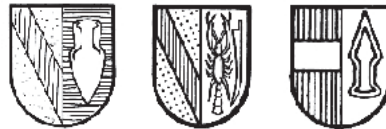
Wappen der Gemeinden DENZLINGEN - VÖRSTETTEN - REUTE

Wir suchen für unser Hauptamt in der Gemeindeverwaltung Vörstetten vor den Toren Freiburgs zum nächstmöglichen Zeitpunkt eine/-n