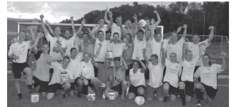
Die Gewinner des 6. Südbadischen FasnetsCups, die Gundelfinger Dorfhexen, freuen sich über ihren Sieg. (auf eigenen Wunsch wurden die zweitplatzierten, die Leheneckbestien Heuweiler, mit aufs Foto genommen)

Schon während dem Turnier und auch danach wurde mit DJ Feliz ausgelassen bis in die Nacht hinein gefeiert. Vielen Dank an die Anwohner für das Verständnis!